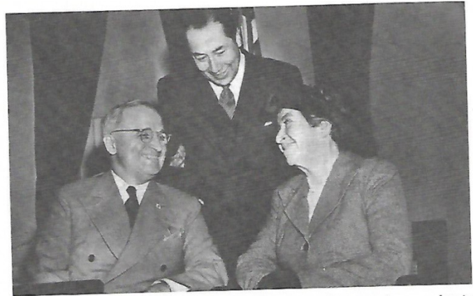
Gabriela Mistral con el presidente de Estados Unidos Harry Truman, primer mandatario del mundo en recibir a la Premio Nobel en la Casa Blanca. Mayo de 1946.

Las universidades Europeas, estadounidenses y latinoamericanas realizan permanentemente conferencias, talleres, seminarios, etc., con la obra de la profesora Gabriela Mistral. Realice sendas conferencias en la universidad de Humboldt/Berlín/Alemania y en la de Lomonosov de Moscú/Rusia. Estos ensayos fueron traducidos al alemán, ruso, francés e inglés por la Señora Gerda Bottcher, directora de la revista Latinoamérica un Pueblo Continente®. Además, comento las entrevistas de la profesora Gabriela Mistral con el Papa en el Vaticano y con el presidente de Estados Unidos, en Washington después de haber recibido el premio Nobel.