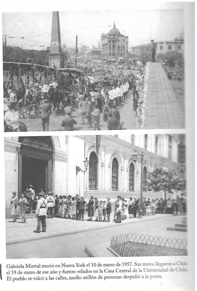
Gabriela Mistral murió en Nueva York el 10 de enero de 1957. Sus restos llegaron a Chile el 19 de enero de ese año y fueron velados en la Casa Central de la Universidad de Chile. El pueblo se volcó a las calles, medio millón de personas despidió a la poeta.